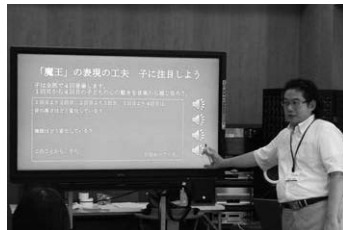
▲自作のデジタル教材で、教材の提示方法を工夫できますよ