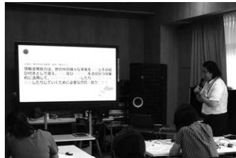
▲情報活用能力について考えます