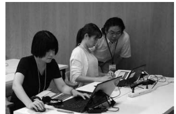
▲プレゼンテーションソフトの操作方法も詳しく解説