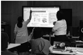
▲受講者自己紹介を通して、それぞれのICT活用状況を共有

前半の講義の内容は、音鑑の後援（講師派遣）事業で実施しているICT研修でも扱っており、お話だけではなく、ICT活用の体験ワークを通して理解を深めていただきます。詳細はONKANウェブネットに掲載しておりますので、ご活用ください。（林田）