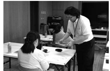
▲タブレットPCを使った情報共有を体験