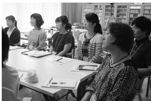
▲各学校の取り組み状況などを情報交換しました